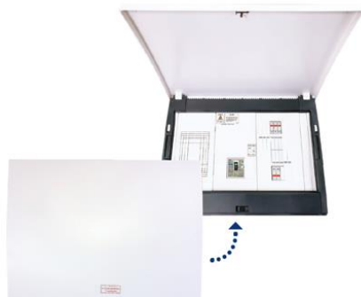
スマートエルラインライト (重要負荷分電盤)