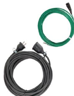
屋外電源用接続ケーブル(10m) ※アースケーブル付き